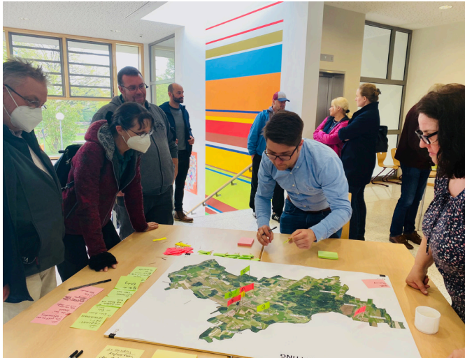
Zukunftsworkstatt vor Ort

Beim Thema Gewässer im Ort wünschen sich die Pruttinger