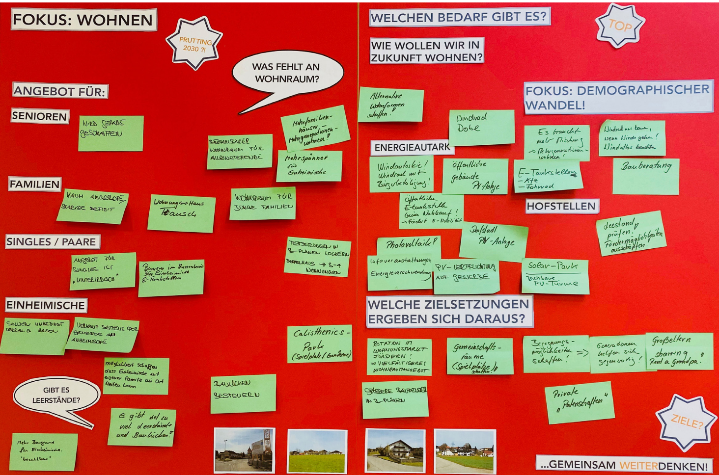
Plakat mit Dokumentation der während der Bürgerwerkstatt entstandenen Ergebnisse

In der Kategorie „ Lieblingssort “ sind zahlreiche Orte zusammen gekommen. Sie sind als grüne Fähnchen auf dem Luftbild zu sehen. (s. Foto rechts)