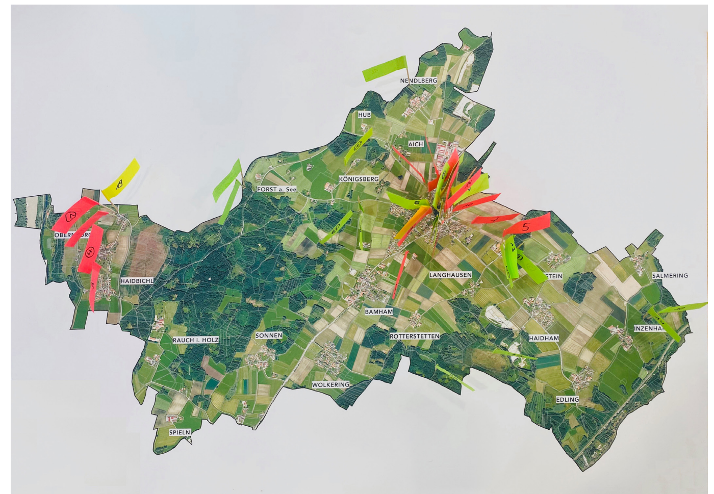
Liebingsorte und Orte mit Vorschlägen zur Aufwertung , kartiert durch die Bürgerinnen und Bürger

Die nächsten Termine zu Veranstaltungen im Rahmen des Gemeindeentwicklungskonzeptes finden Sie auf der Homepage der Gemeinde. Zudem werden alle, die sich in die Verteilerliste eingetragen haben, gesondert informiert. Wir freuen uns sehr auf Ihre Teilnahme!